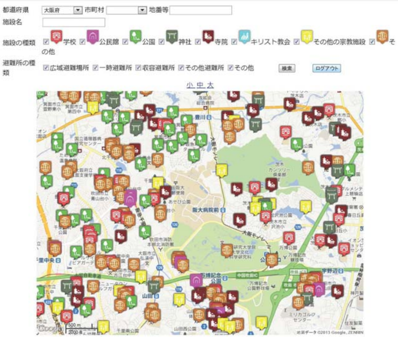
未来共生災害救援マップ（略称：災救マップ） http://www.respect-relief.net/