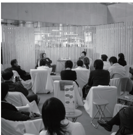
[写真2]カフェバトル。センタースタッフ全員が公衆の前で対談を行った

金水 CSCD の開設後まもなく大阪梅田のビッグマン前広場でやった「カフェバトル」[写真2]も斬新でした。研究者がガチンコで入れ替わり立ち代わり、6時間におよぶトークイベントをやりましたね。