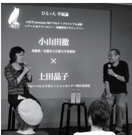
[写真4] 知デリ。研究者とアーティストらが表現や技術について対話する

— お話をまとめますと、コミュニケーションデザインという取り組みが化学反応としてあぶり出せる部分と、潜在的にしか機能しない部分があるということですね。化学反応としては、事務も含めて空間的な共有の場をつくり、初の大学院カリキュラムというものをつくり、「カフェバトル」をはじめさまざまなイベントを実現しました。さらに「知デリ」[写真4] や「ラボカフェ」のような継続的なイベントを行う常設スペース（アートエリアB1）もつくりました。そういった数々の業績は、化学反応の成果だと思うのです。一方で、化学反応ではあぶり出せない潜在的な機能とは何なのか。