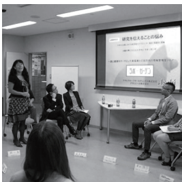
[写真5] アサヒ ラボ・ガーデン×CSCD 共同研究のようす