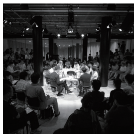
【写真3】アートエリア B1 での 10 周年記念イベント「知のジムナスティックス」

—— “行きずりの人”と対話する、つまり特定のコミュニティを相手にしないという、そういう覚悟がありました。そこに「アート」という観点がありましたね。「アート」はどこにも属さないものですから、“はみ出ることを良しとする”という思考があったのかもしれない。