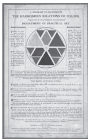
【図2】 "A Diagram to Illustrate the Harmonious Relations of Colour", 実用美術局, 1853年 印刷: Chapman and Hall (53.8cm × 34.7cm)

その結果、テキスト『色彩の基本入門書：教理問答集』（1853年）の巻頭には、色彩の調和的關係を説明した立体図が掲げられた【図3】。先の色図がフィールドに基づく一次色・二次色・三次色の成り立ちを主に教えようとしていたことに対して、こちらの立体図では割合と量、対比を図示している。テキストは冒頭でこう説明する。「入門書に含まれる問答は、実用美術局で参照されるように準備されたが、別個の図を足すことが望ましいと検討されてきたから、色彩を互いに調和させる正確な表面量を示すよう手配した 35 」と。