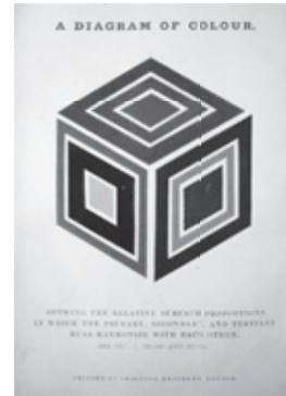
【図3】 Redgrave, An Elementary Manual of Colour , Chapman and Hall, 1853. (扉絵の図式)

テキストは3部構成で、明文化された短い教条93節、全36頁からなる小型本である。第一部の全50節では、主としてフィールドの相互的な調和を導く割合を、第二部の全30節ではシュヴルールに基づく対比の諸関係、第三部の全13節では濃淡と明暗による調和について説く。教えと同数の問題を導入することによって、学生が内容を記憶し、習得度合いを試せる仕組みになっている。三部の3節で、レッドグレイヴはこう述べる。