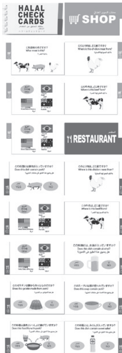
図2 「HALAL CHECK CARDS」

本稿では、イスラム教徒の人々に向けて、日本の食事に戸惑う人を少しでも減らし食のストレス緩和のため、『HALAL CHECK CARDS』の開発プロセスとツールの内容について概説した。今後のツールの開発は、実際に様々な国のイスラム教徒、特に日本に來ても間もないイスラム教徒の人に使ってもらい、その意見を集積していき改良へと進んでゆくこととなる。そして、携帯端末のアプリケーションの開発に展開していく予定である。