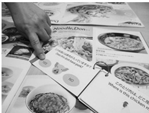
図1 プロトタイプを使用しているシーン

ヒアリングから「実際にお店の人に聞けるツール」が必要であることがわかり、プロトタイプを制作し、ムスリムの家族に使用してもらった（図1）そして改良を加えて完成し