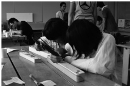
リユーターによる木彫り装飾

ワークショップには、計18組の親子が参加し、椅子の組立作業とペン型リユーターによる木彫り装飾を行った。このワークショップで制作された椅子は気仙沼市元吉町小泉地区にて保管され、お祭りなどの地域イベントにて活用されている。