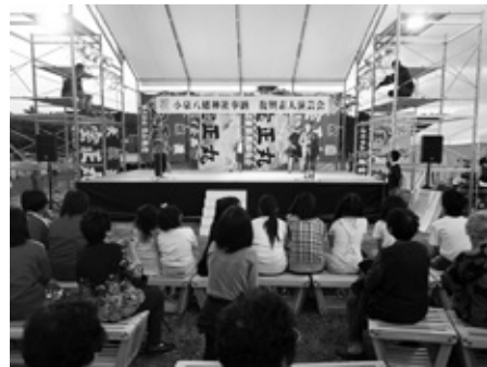
元吉町小泉地区の秋祭り

今後地域のお祭りなどのイベントで地域の椅子として長く愛されることを期待している。