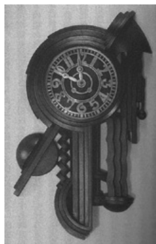
図2 内藤春治《壁面への時計》1927年、東京国立近代美術館蔵

以上の如く、杉田禾堂は機械製品である〈産業工藝〉を意識した上で、柳の推奨する〈民藝〉が近代社会においては非-実用的でしかありえないこと（価格・生産性・変化する生活様式への対応などの諸点において）を示唆した。また〈用即美〉の理念に関してみても、〈工藝美術〉の担い手たる自分の方が柳よりも積極的に推し進めているものと、杉田は自負していた。実際、杉田に限らず20~30年代の工藝美術家は、近代生活に相応しい〈用〉のありかたについて、また工藝作品における〈用〉と美質との関係性について、柳が思う以上に意識的であったといえよう。たとえば「无型」所属の内藤春治は、「現下日本の生活は世界的にまで這入り其の拡充されつゝある生活環境の変化は、自然現代人の美意識及び美の対象の上にまで変化をもたらしてゐる。従つて取材、表現及用途と、工藝美術の姿態に著るしき変化進展を見つゝある」 21 と説いた上で、近代都市生活に相応しい実用性を持つ《壁面への時計》（1927年帝展入選作、図2）などの作品群を発表した。また「工人社」の信田洋も、「工藝の実際の本質——実用的要素を主体として包裹する所の美を工藝の主体として把握し、時代意識のもとに製作行為する」 22 と宣言した上で、機械の新奇なメカニズムをイメージした《いんく・すたんど》（1929年、図3）などの作品を手がけている。これら若手作家からみれば、過去の遺物ともいふべき〈民藝〉に即して〈用即美〉を説く柳の姿勢は、いかにも時代錯誤に思われたのではないか 23 。実際、杉田・内藤と並ぶ「无型」幹部であった高村豊周は、〈民藝〉の非-実用性を杉田同様に指摘した上で、〈民藝〉の美質は必ずしも「実用性」の所産ではないとの見解を示している。1931年の論考より引きたい。「(民藝の——引用者注) 素朴にして親しみ易い美とそして実用性とは恐らく誰れにも好感を与へるに違ひない。しかし、注意すべきことは、そこにある実用性は消極的に内在してゐるものであつて、僕たちの今日の生活に働きかける活発な機能を持つてゐない、低徊的な趣味の生活に静かに働きかけてゐるに過ぎない、といふ事である。それを美と感じ（これは誰れでも慥かに感じる）立派に使へると思ふのは、個人的な数寄な好みであつて、決して実用性の基本的な発動ではない」 24 。