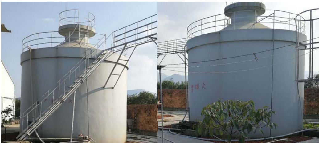
图 1 马岙顺达牧场的沼气设备

养猪会产生大量粪便,需要设置污染防治系统来处理。首先是干湿分离,之后污水经过以下过程来处理:污水→沼气池→溶气气浮机加药处理沉淀池→水解酸化池→好氧曝气氧化池处理沉淀池→无害化排放粪便→干清粪工艺入堆粪棚→资源化利用。其中最为关键的设施就是沼气池。