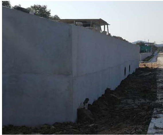
图 2 新建的 400 立方米的沼气池

另一方面，为了响应浙江省倡议的建设美丽（生态）牧场的号召，该牧场还开始新建 400 立方米的沼气池（图 2） 13 。