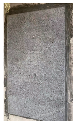
図4 「功德碑」に記載された名前と日付