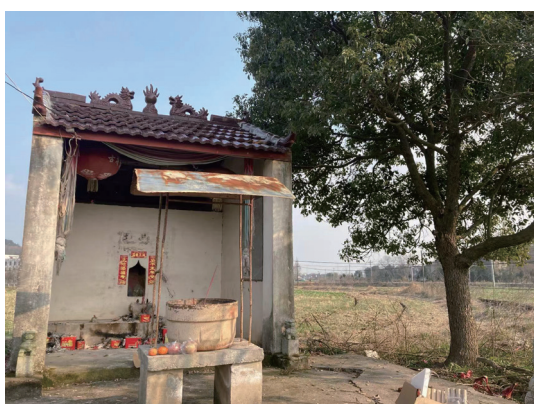
図3 2011年に新しく製造された土地神の祭壇