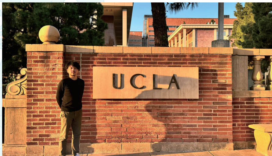
UCLAの校門と就職初日の自分

異文化との触れ合いも、ロサンゼルスでの生活の大きな醍醐味です。中学生になる娘たちは日本人のほとんどいない現地校に通い、日本からしていたバスケットボールを通じて友人を作りました。彼女たちは日本人の仲間ともちろん交流しますが、日本語が話せない日系アメリカ人とも自然に打ち解けています。さらには生粋のアメリカ人とも一緒に練習や試合を楽しんでおり、その受け入れの柔軟さには感心しています。言葉や文化の壁