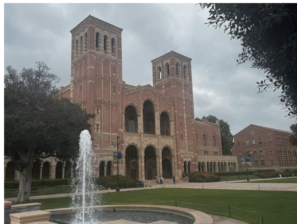
UCLAのシンボルであるロイスホール

に戸惑うこともあります。スポーツを介したコミュニケーションは想像以上にスムーズで、子ども同士が多様性を自然に受け入れる姿を見るたびに、大人として学ぶところが多いと感じます。また、娘達のバスケットチームの保護者で作る大人のバスケットチームに参加させてもらい、私自身が1月から現地リーグでプレーさせてもらってます。2m超えの黒人センターがチームメイトにいたり、米国人のボディコンタクトの強さを知り貴重な経験を積んでいます。