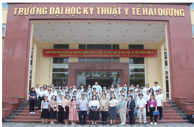
国際看護学実習Ⅱベトナムにて