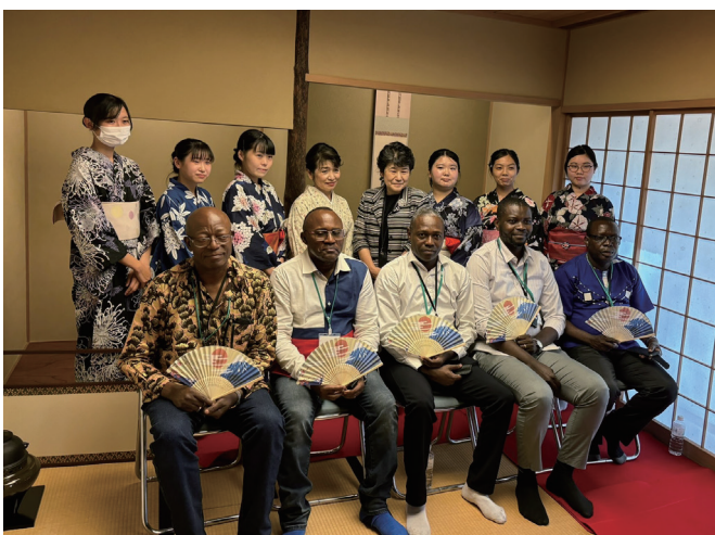
JIHS国際医療協力局が実施する医療技術等国際展開推進事業でコンゴ民主共和国より来校

こうした教育と研究の基盤を通じて、本学は、国内外を問わず、看護職が日常の実践からグローバルヘルスの推進に貢献できる力を培う場となっています。