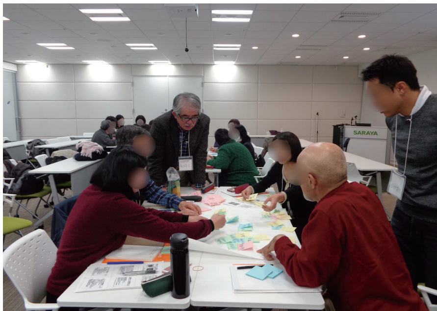
写真：KGHの対面セミナーの様子

ですが、当時はまだ誰も使い慣れておらず、手探りでスタートでした。さらに嬉しい悲鳴と言えそうですが、申し込みを始めてみると、予想をはるかに超える多数の参加申し込みがあり、Zoomではキャパオーバーになってしまいました。当時はまだこうしたオンラインセミナーを無料で開催しているところですが、とても少なかったからだと思います。色々調べた結果、ZoomをYouTubeに接続することで制限なく視聴者を募ることができることが分かり、試行錯誤の末この方法を会得しました。