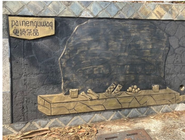
写真 5/先祖へ供物を捧げる様子を表した壁画(屏東県来義郷)

パイワン族の伝統儀式において、檳榔は主に祖霊祭と収穫祭の二つの儀式で利用されていることが明らかになった。祖霊祭とは、パイワン族の一部集落 6 において伝承されている、部落の豊作や平和を祖先の霊に祈る儀式で、5年に一度、5日間かけて行われる。自身の体内に入るものや身につけるものを供物して捧げる祖霊祭において、檳榔も祖先への供物として扱われる。しかしこれは全世帯共通の習慣ではなく、檳榔を日常的に利用する家庭のみの習慣であるという。