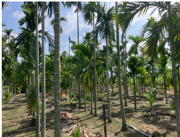
写真1/檳榔を栽培している農園(台湾,屏東県枋寮郷)

このような自身の考えから、本研究ではパイワン族とルカイ族における檳榔を利用した生活文化の調査および文化に類似性を持つ両民族間での比較を行った。