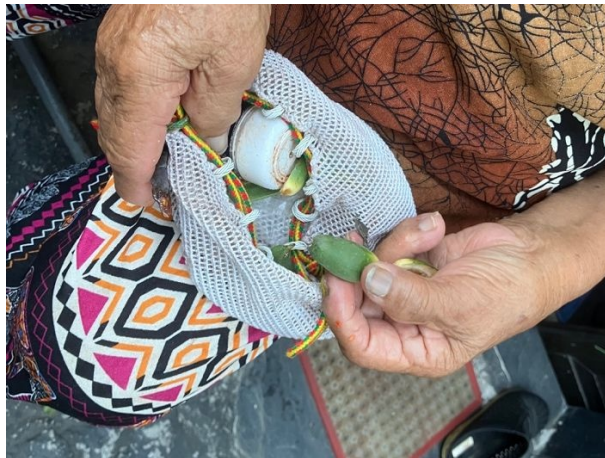
写真 6/ルカイ族の住民が檳榔を調理している様子(屏東県霧台郷)

パイワン族の際と同様に、ルカイ族に関しても集落での現地調査を中心に調査を実施した。確認された檳榔の利用方法を分類すると、パイワン族と同じように、「嗜好品としての利用」、「伝統儀式での利用」、「結婚・縁談での利用」、「おもてなしの品(贈答品)としての利用」、「境界線としての利用」の5つに主に分類できる。以下ではそれぞれの利用方法について整理する。