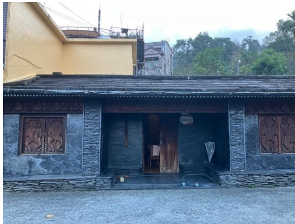
写真 3/復元された石板住居(屏東県霧台郷)

首長制度をはじめとした両民族の社会面と同様に、文化の側面においてもさまざまな面でルカイ族とパイワン族の同質性を見出すことができる。その中でも代表的な例として挙げられるのが石板家屋である。石板家屋は、伝統的なパイワン族およびルカイ族の住居であり、平らな石を積み重ねて建築される平屋建ての住居である。しかし現存する石板家屋は少ない。パイワン族の住民によると、これは戦後、中華民国政府によって両民族の住民が山間部から平地へ移住させられ、その時から漢式住居に住み始めるようになったことが要因であるという。一方で現在でも観光施設や公共施設などで石板家屋の壁面を模したデザインを取り入れているものや、少数ではあるが復元された石板住居が存在する。このように現代において、石板家屋は両民族の文化的アイデンティティを象徴する重要な役割を果たしていると考えられる。