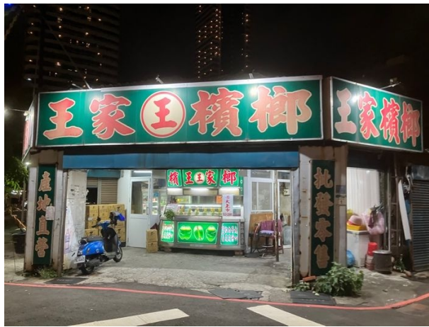
写真2/檳榔を嗜好品として販売する店(高雄市前金区)

このような自身の考えから、本研究ではパイワン族とルカイ族における檳榔を利用した生活文化の調査および文化に類似性を持つ両民族間での比較を行った。