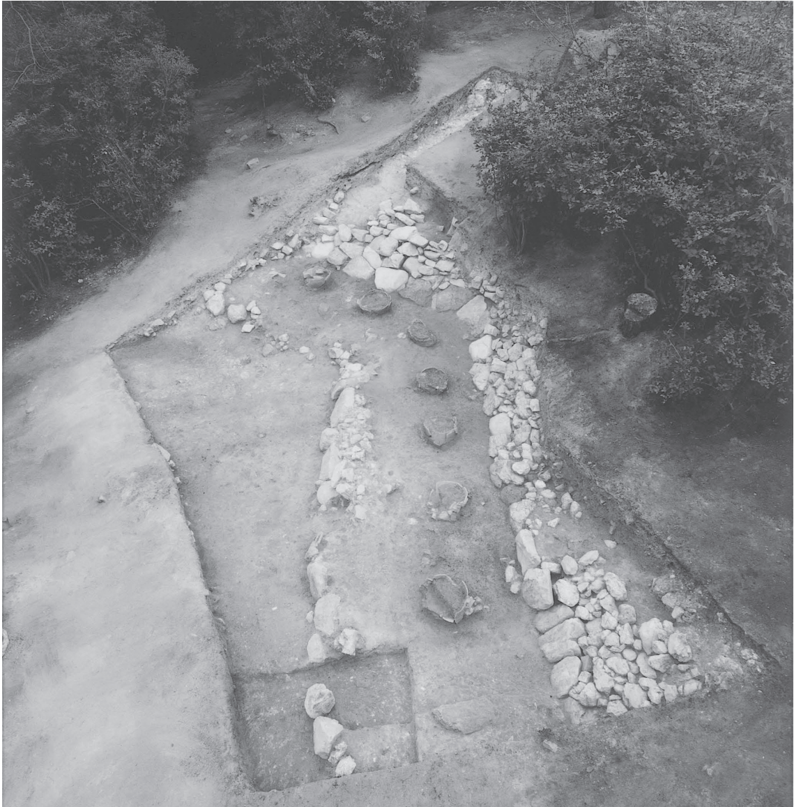
1 南クビレ部2008調査区全景1 (東から)