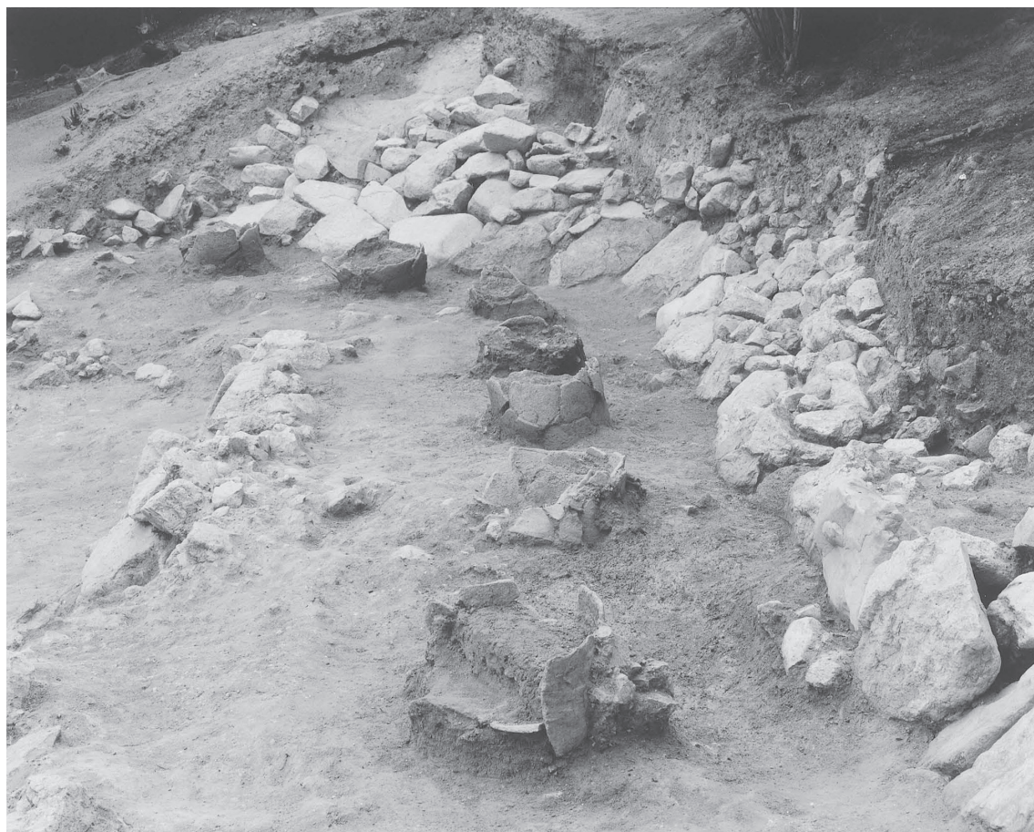
2 南クビレ部2008調査区における埴輪列検出状況（東から）