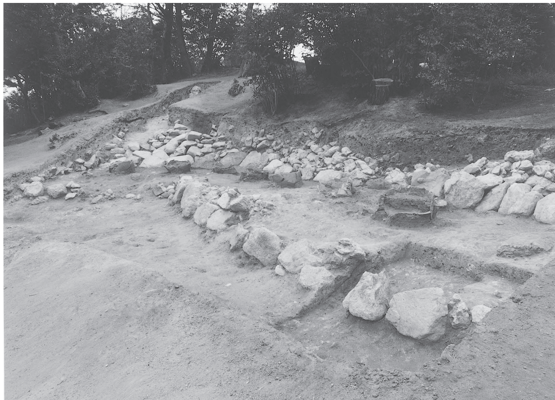
1 南クビレ部2008調査区全景3（南東から）