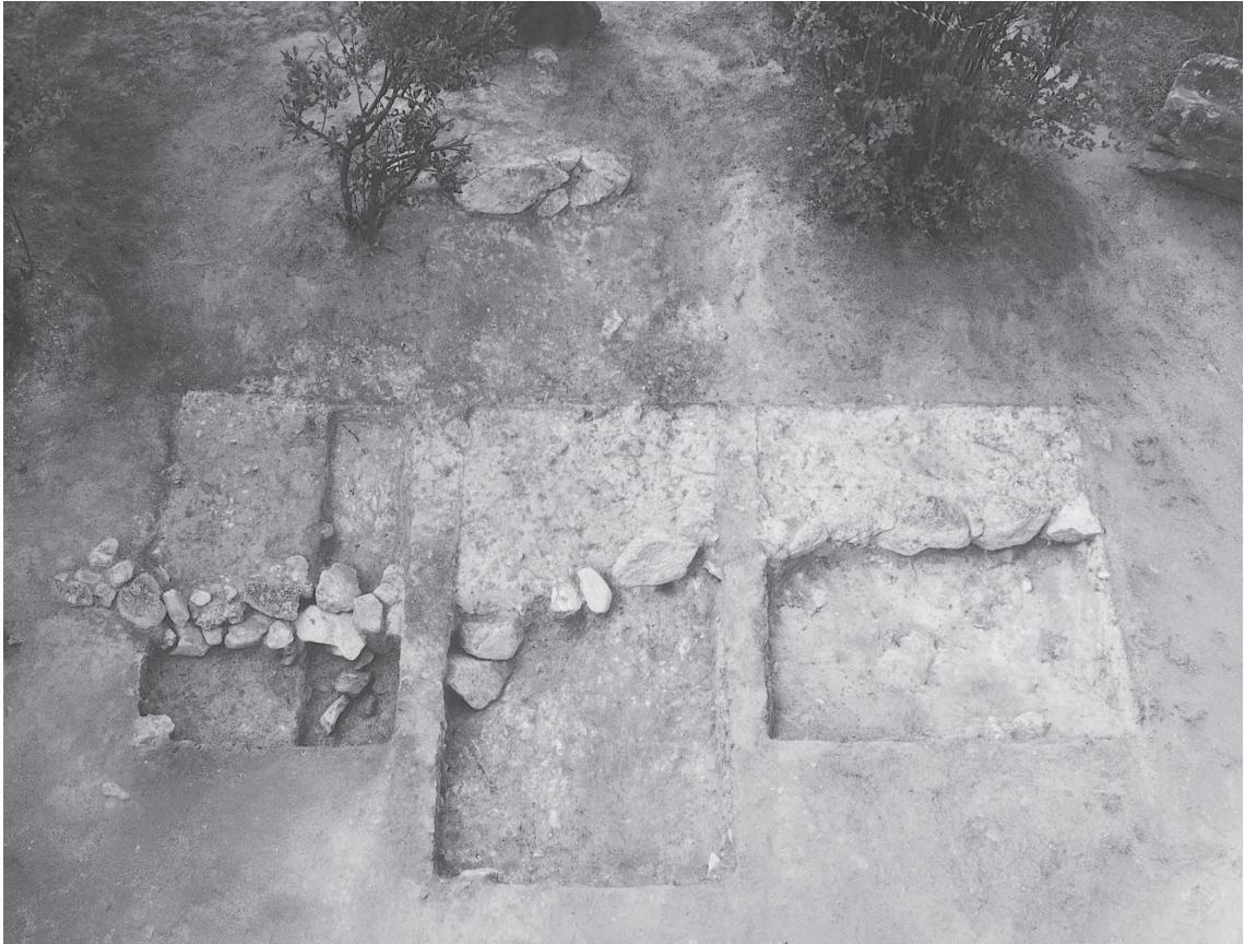
1 前方部2008-1トレンチ全景1 (南東から)