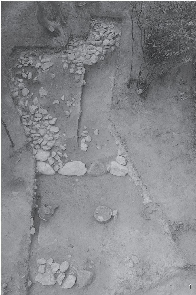
1 後円部2009調査区全景1 (東から) 3 後円部2008トレンチ (東から)