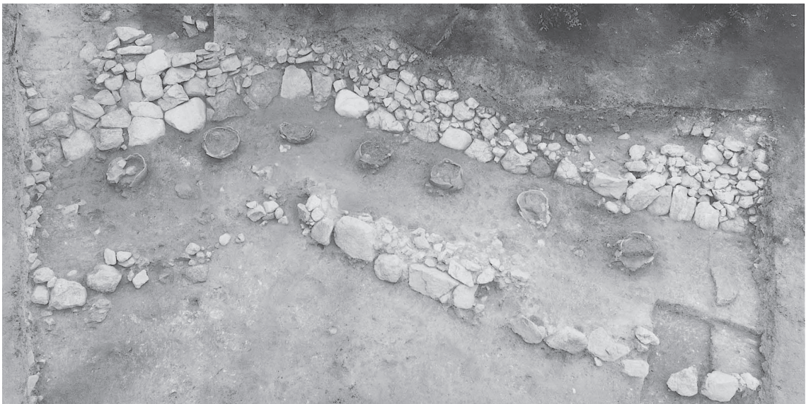
2 南クビレ部2008調査区全景2 (南から)