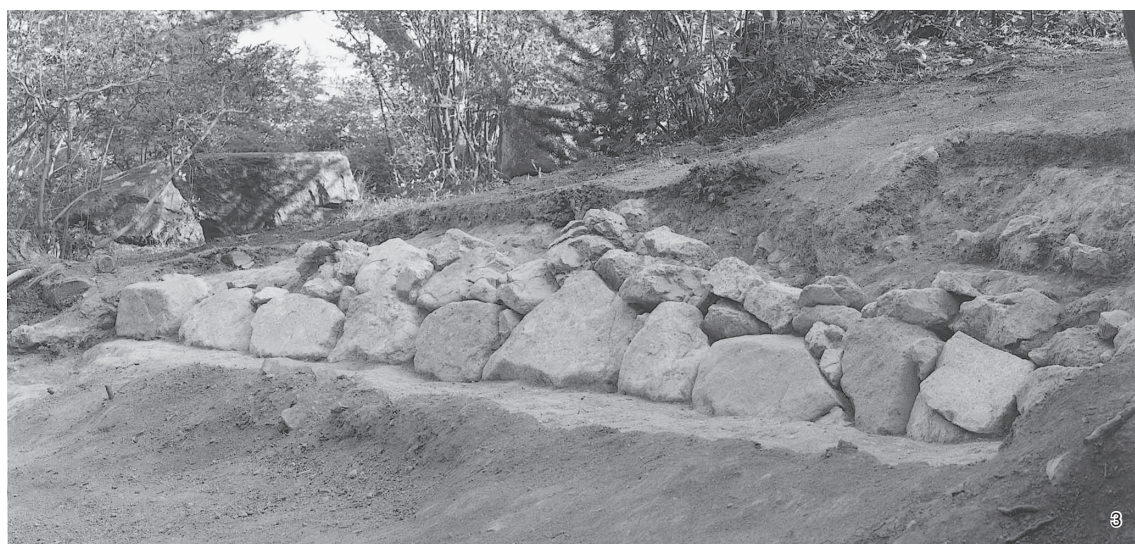
1 前方部2009-1・2トレンチ (左:1トレンチ、右:2トレンチ、東から)