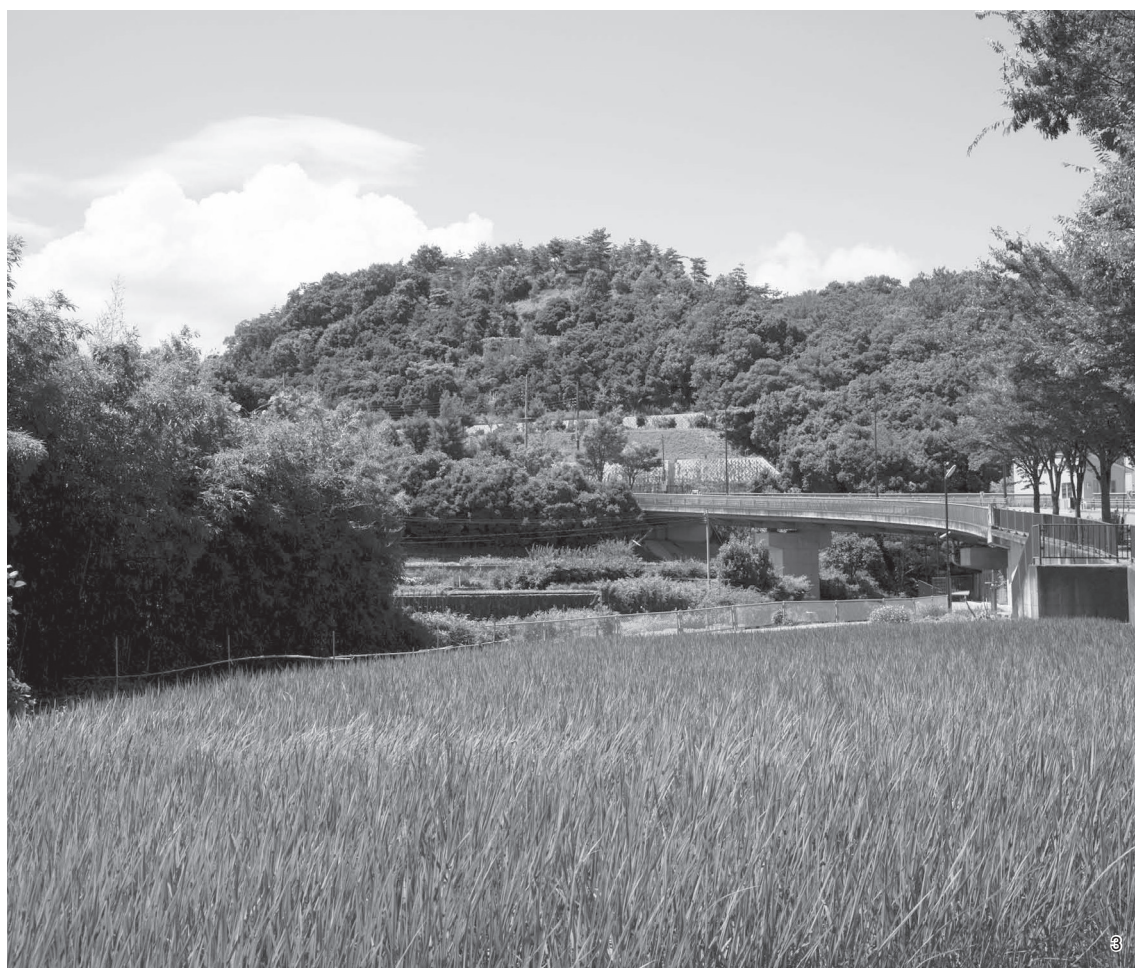
1 上空から見た長尾山古墳（南から） 2 長尾山古墳と西摂平野（北から） 3 長尾山古墳遠景（南から）