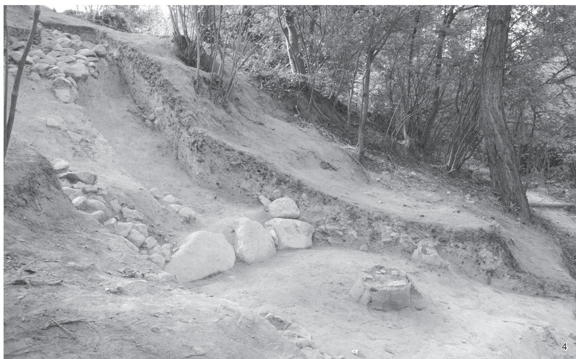
4 後円部2009調査区 (南東から)