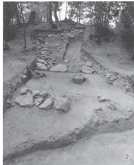
2 後円部2009調査区全景2 (東から)