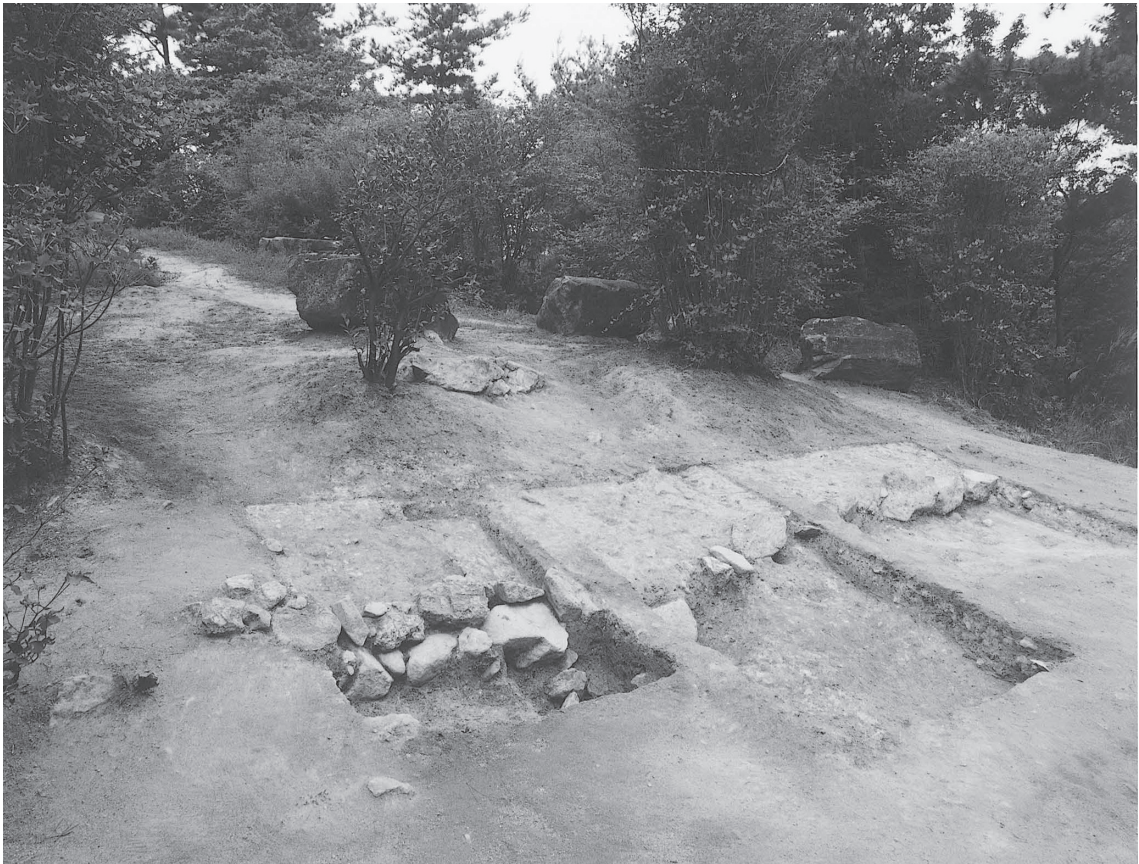
2 前方部2008-1トレンチ全景2 (南から)