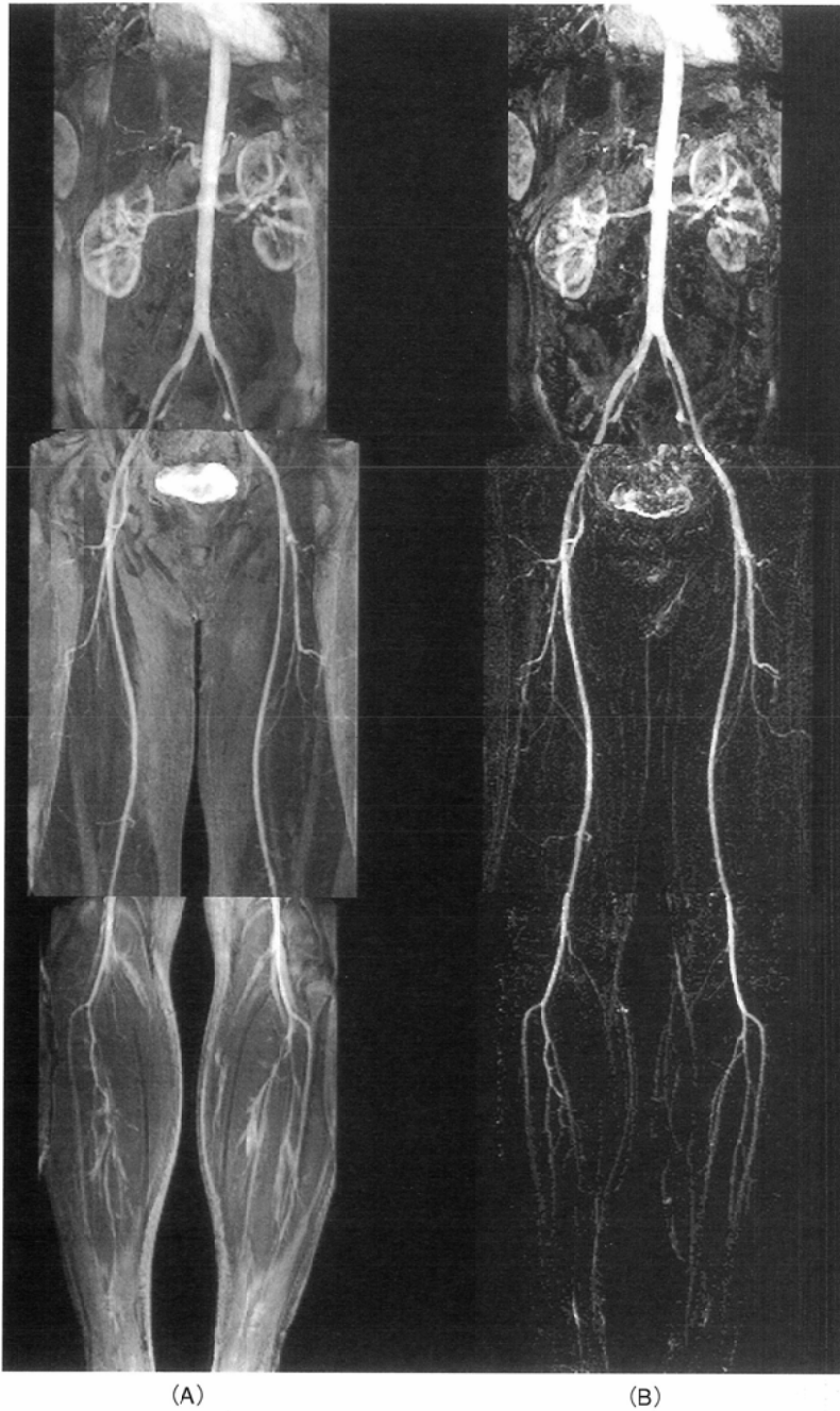
Fig.1 Normal volunteer A: MRA B: MRDSA MRDSA is superior to MRA in depicting the normal anatomy of arteries of lower half body.