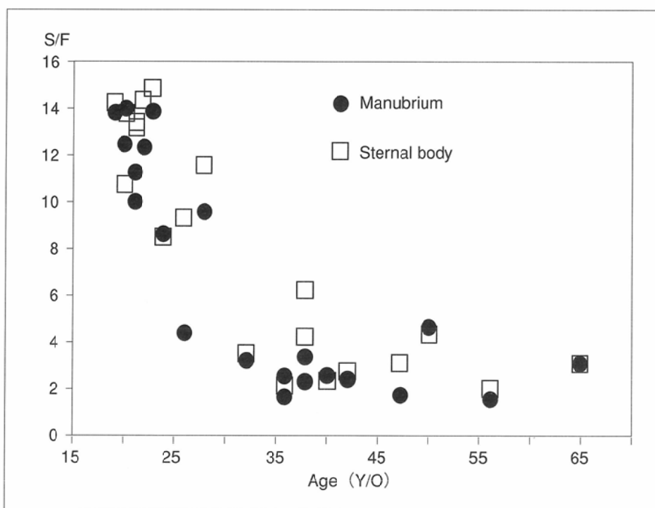
Fig.3 S/F signal intensity by age

矢状断骨髄像MRIから、Type 3は、高齢者に目立っており、胸骨においても、造血髄から脂肪髄への転換の様子が良好に描出される結果となった。Type 2として分類した4例は、局所低信号が胸骨柄上部前側に存在していた。脂肪髄が優位なType 3でも、胸骨柄上部前側には必ず脂肪化が認められており、このことから脂肪髄への転換部位として胸骨では胸骨柄上部前側から始まると考えられた。この所見は従来より報告されている組織学的知見と一致していた 4) 。