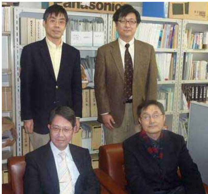
前列右が盧教授、左が阿部屋長。 後列右が進藤准教授、左が菅講師。