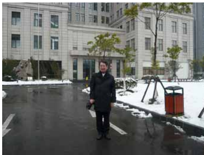
上海社会科学院図書館

3. 続いて人事に関して以下の説明がなされた。上記(1)には次の5つのレベルの専門家計40人が勤務している。①研究館員（トップ）、②副研究館員、③館員、④助理館員、⑤図書館