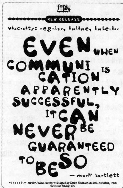
Fontboy web site USA