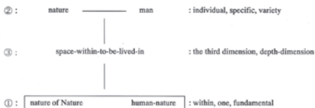
【図6】自然に倣う建築のあり方の構造 (筆者作成)