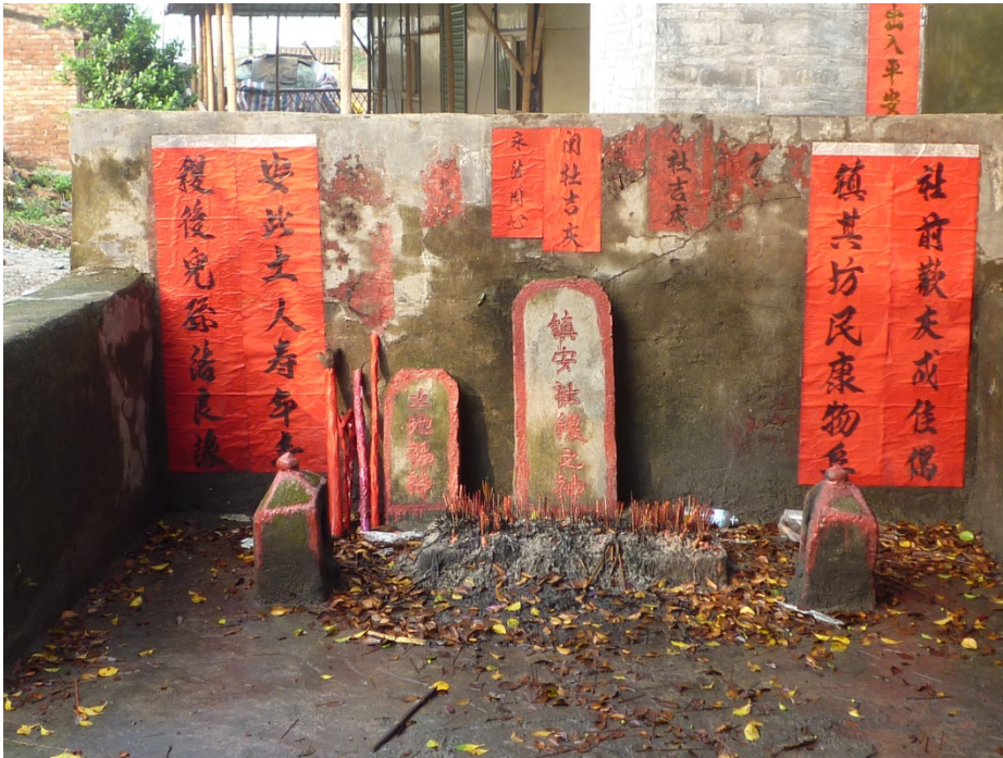
写真6 振星村三組の鎮安社