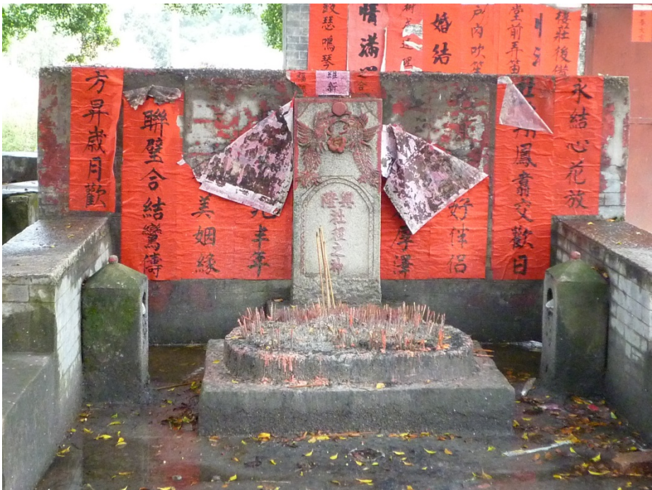
写真5 振星村二組の興隆社