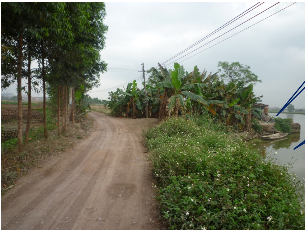
写真2 横涌湖と三甲の鴨埗