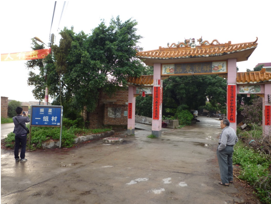
写真4 振星村の入り口