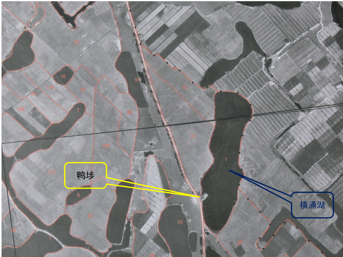
写真3 衛星写真上の鴨埗の位置