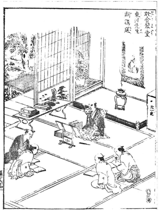
含翠堂にて 伊藤東涯講義の図 撰津名所図会