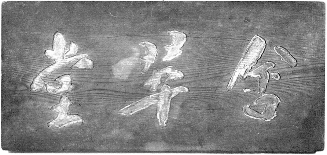
三宅万年筆 含翠堂 木額