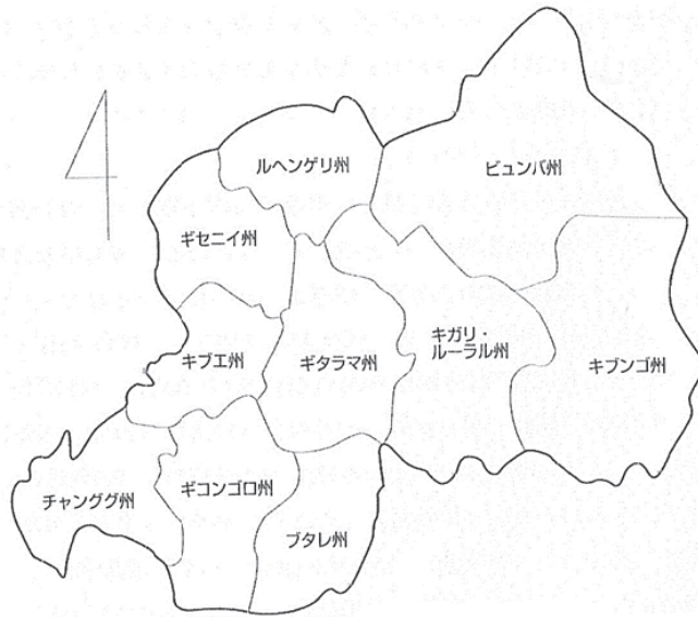
図1 1994年のルワンダ行政区画