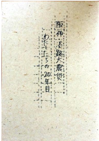
図 1. 11 巻目の手記集『阪神・淡路大震災 わたしたちの 20 年目』

以上のような編集作業を経て完成した手記集は、2015 年 1 月 11 日より現在まで同会のホームページから申し込む形で希望者に郵送にて配布を行っている。また、神戸市中央区の人と防災未来センター資料室や宮城県仙台市のせんだいメディアテーク 1 階のカネイリミュージアムショップ 6 にて、無料配布、または委託販売（1 冊 500 円。売上は同会の活動支援金に当てられる）を行っている。