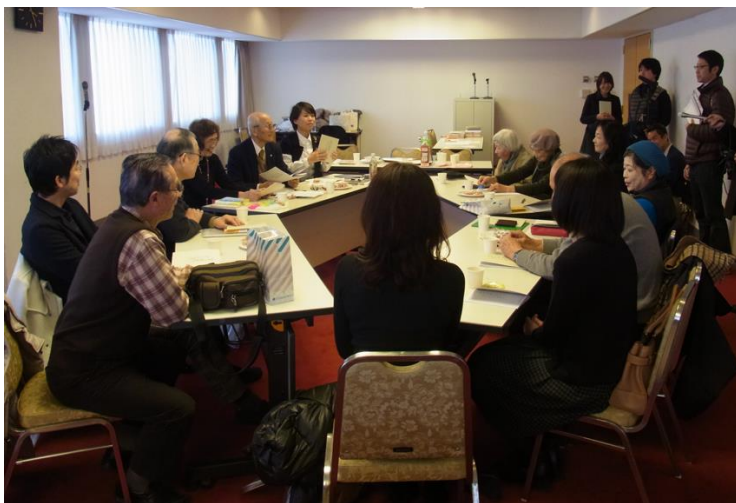
図 4. 手記集完成記念会の様子

会場となった兵庫県民会館は記録しつづける会の 1995 年から 2005 年までの毎年の出版記念会の会場でもあり、2010 年からは年一回の執筆者の交流会でも使われてきた、馴染みのある場所である。記念会にあたっては、会議用の長机を變形の口の字に配置し、参加者が互いの顔を見ながら対話が行えるような形とした。また、会議室奥にお茶やお菓子を置くことで緊張感を解き、自然に歓談へと流れるよう配慮した（図 4）。