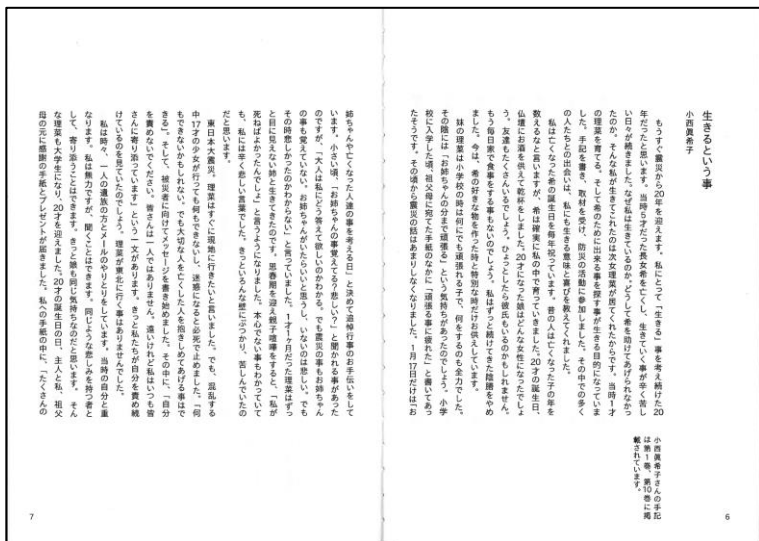
図2. 手記集レイアウト例1