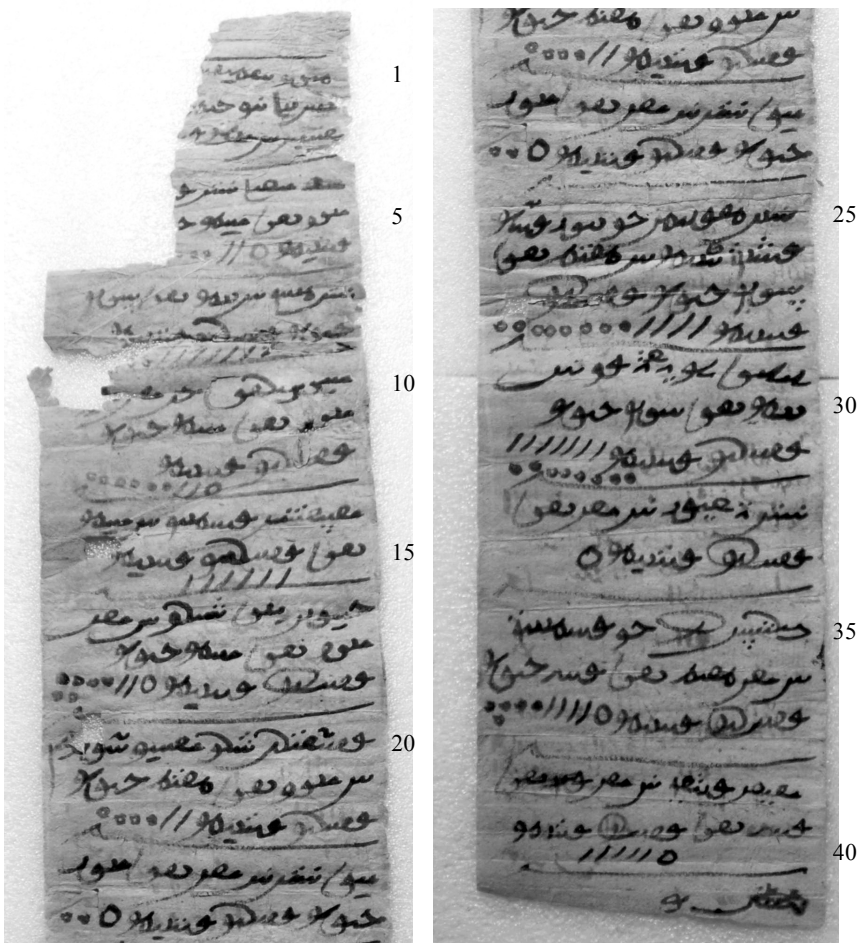
巴楚县托库孜萨来古城出土回鹘文文书 (A)