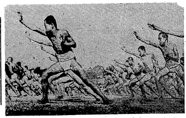
Text describing the illustration, likely related to labor or agriculture.