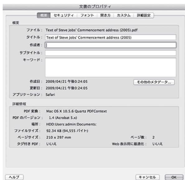
図 3 Adobe Acrobat でのプロパティの確認 (2)