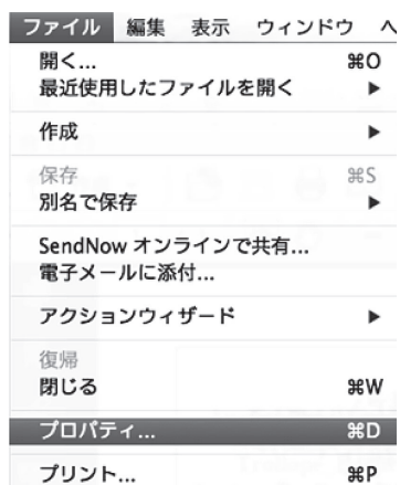
図 2 Adobe Acrobat でのプロパティの確認 (1)