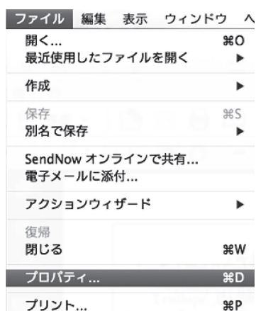
図 2 Adobe Acrobat でのプロパティの確認 (1)