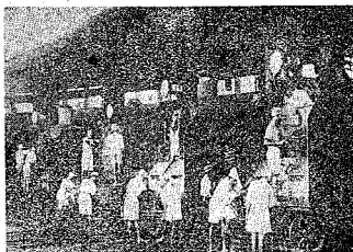
此為某君與其家人之合影。圖中可見數人，包括男女老幼，均著裝整齊，背景似為戶外廣場。

此為某君與其家人之合影。圖中可見數人，包括男女老幼，均著裝整齊，背景似為戶外廣場。此類照片在當時極為珍貴，記錄了家庭團聚的時刻。