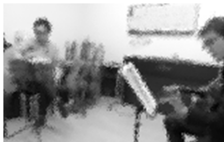
図1 講師(左)、受講者(右)

レッスンは通常、受講者が入室、挨拶、ギターや楽譜の準備、レッスン、受講者が退室という流れで進んでいく。本稿では受講者の入室後、レッスンが開始して5分ほど経過した時点のやりとりを分析する。講師と受講者は椅子に座って向かい合い、どちらもギターを持ち、目の前の譜面台にテキストを開いた状態で置いている(図1)。より正確には、講師は斜め右に、受講者は斜め左に譜面台を置いている。テキストのページには現在扱っている曲の譜面が掲載されている。