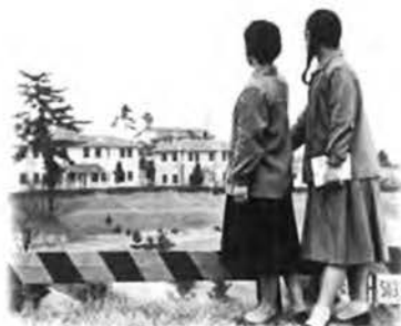
図3：刀根山ハウスと大阪大学女学生『大阪大学の50年：写真集』：85