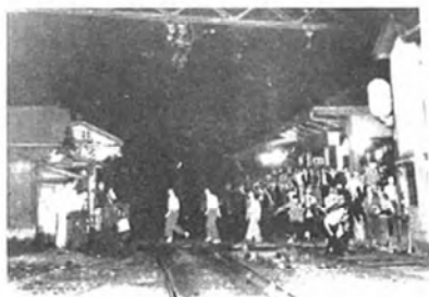
図5：吹田事件で石橋駅に集結した学生 『大阪大学 50年史』：277