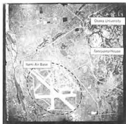
図1：大阪国際空港周辺地域の地図 米軍航空写真（1948年3月撮影）を基に筆者作成