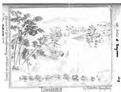
図4：Aの姉が描いた刀根山ハウス 『清酒発祥の地 兵庫県伊丹市』「2009 年年頭雑感」 http://aranishi.hobby-web.net/3web_ara/nenga21_1.htm#ojh より (2018年7月10日最終閲覧)