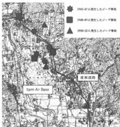
図6：進駐軍事故現場地図