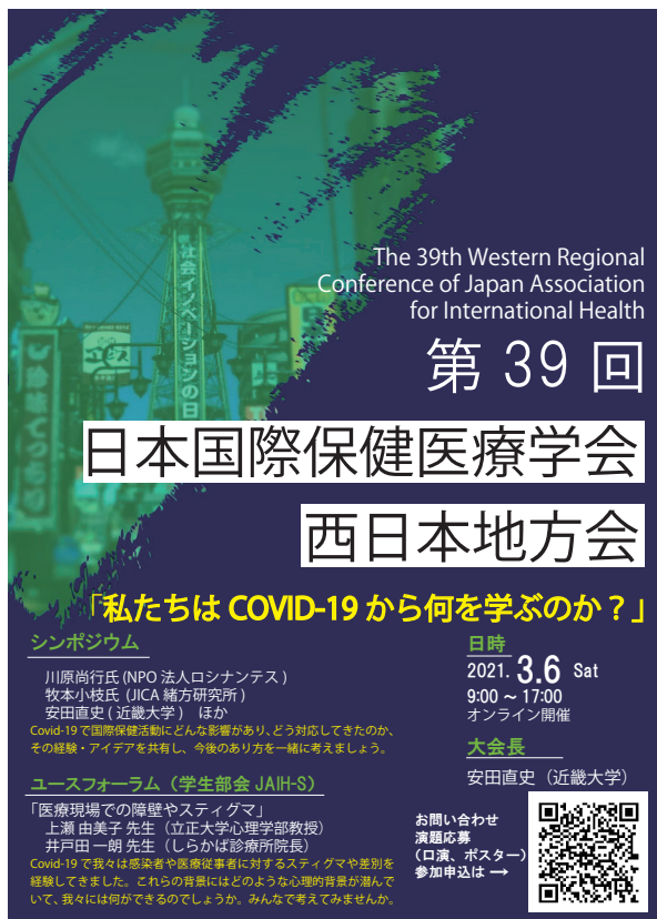
(写真1) 日本国際保健医療学会西日本地方会のチラシ