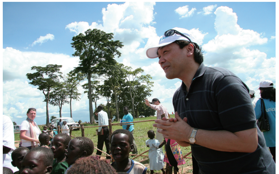
写真1 著者 ウガンダの難民キャンプで