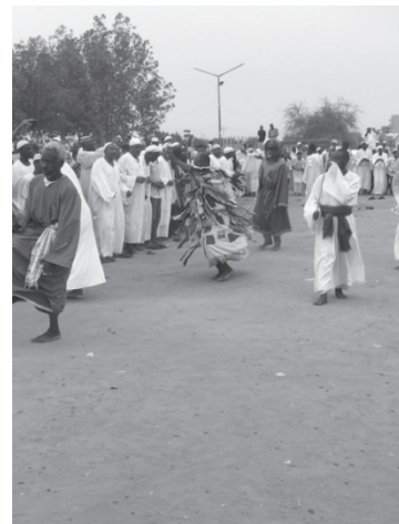
スーダンでスーフィーダンスを踊った