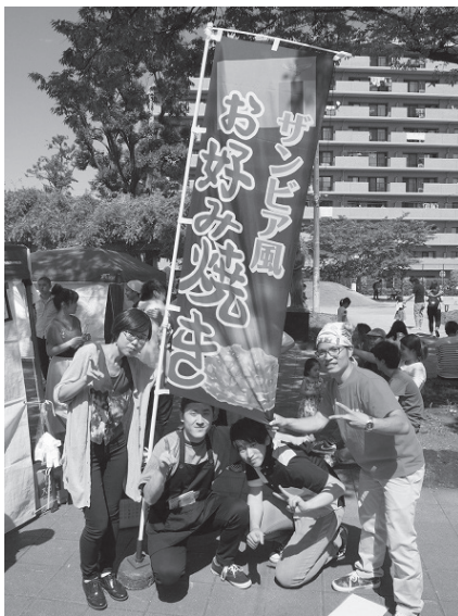
ザンビア風お好み焼き出店の様子