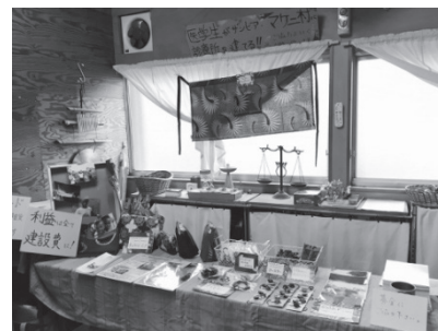
ザンビアの布から メンバーが手作りした手芸品