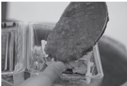
ザンビア風お好み焼き