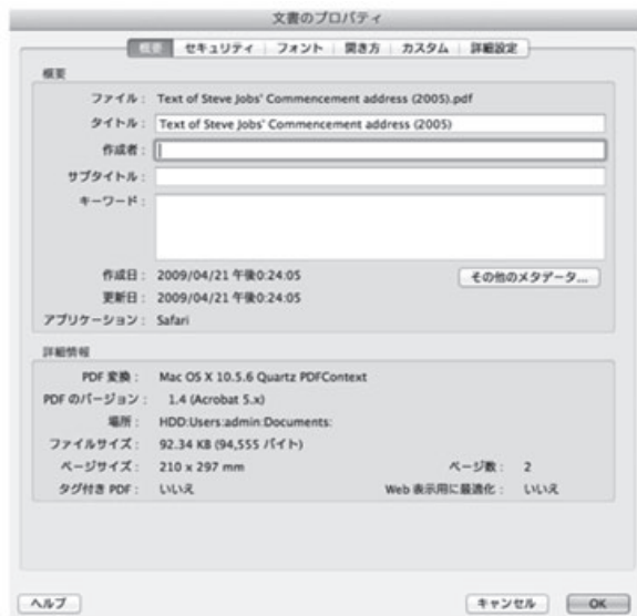
図 3 Adobe Acrobat でのプロパティの確認 (2)