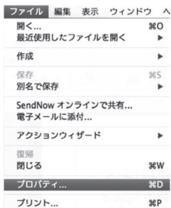
図 2 Adobe Acrobat でのプロパティの確認 (1)