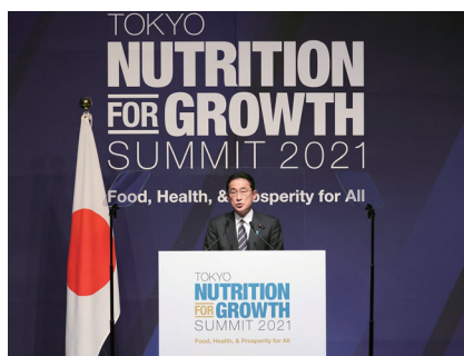
岸田総理の開式挨拶

これまでの栄養の議論は飢餓や低栄養が中心でしたが、今回 N4G サミットでは初めて、生活習慣病等を引き起こす過栄養を取り上げ「栄養不良の二重負荷」に焦点を当てました。これは、現在、世界では 10 人に 1 人が飢えや低栄養に苦しむ一方、3 人に 1 人が過体重や肥満の状態にあるという現状を踏まえたものです。また、持続可能な食料システムの構築を同時に達成する目標を掲げました。これは、食や農業が気候変動等地球に与