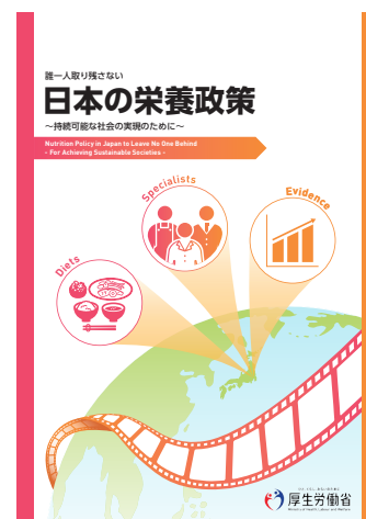
日本の栄養政策 (日本の栄養政策のあゆみをまとめた4文書)

東京栄養サミットの開催には、開催延期やコロナ禍に伴う多くの課題がありましたが、歴史的といわれる成功を収めました。その要因は国際連帯、つまり国内外の関係者の協力を得ることができたためです。サミット開催に際し、国内では、政府内に栄養に関する6省庁が参加する関係省庁会合を設置、国内のNGO・産業団体や各民間企業・学术界もそれぞれがコミットメント作成に尽力されました。サミット準備事務局として、世界の栄養関係者から構成する国際諮問グループを設置し（図4）、その定期会合で関係者の賛同を得ながら進めました。このグループの下に、テーマ別の専門家グループや、ステークホルダー別の代表窓口を置き、国内外の関係者の参加を促しつつ、知見や意見を取り入れました。このように、政府が開催する会議としては新しい発想でオープンな会議運営としたことにより、今後関係者が各々の取組に責任を持ち、SDGs達成に向けた取組が推進されると考えます。この場を借りて関係者のご協力を御礼申し上げます。