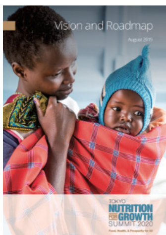
ビジョン&ロードマップ (5つのテーマと議論の方向性を示した文書)

栄養改善には長期的な取組が不可欠で、継続的な進捗確認が重要です。複数のセクターにまたがる課題で、因果関係の分析が容易ではないものの、継続的な進捗確認は必須であるためデータを整備し指標を設定していくことが重要です。この点については、世界の栄養専門家で構成される Global Nutrition Report (GNR: 世界栄養報告) の有識者委員の協力を得て、「アカウンタビリティ・フレームワーク」を新設し、今後、東京栄養サミットのコミットメントをモニタリングする体制を構築しました。