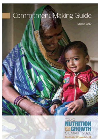
コミットメント作成ガイド (質の高い計画策定の手順や具体例を示した文書)

( https://www.mofa.go.jp/files/100267146.pdf )。日本の栄養分野の国際協力については jica 月刊誌 mundi 2020年1月号に具体的に分かりやすく説明があります ( https://www.jica.go.jp/publication/mundi/202001/index.html )。栄養サミットの説明もあります ( https://www.jica.go.jp/publication/mundi/202001/ku57pq00002rxkt-att/14.pdf )。