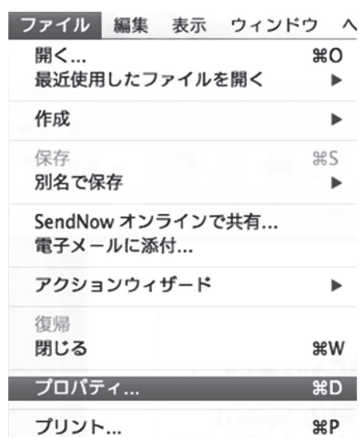
図 2 Adobe Acrobat でのプロパティの確認 (1)